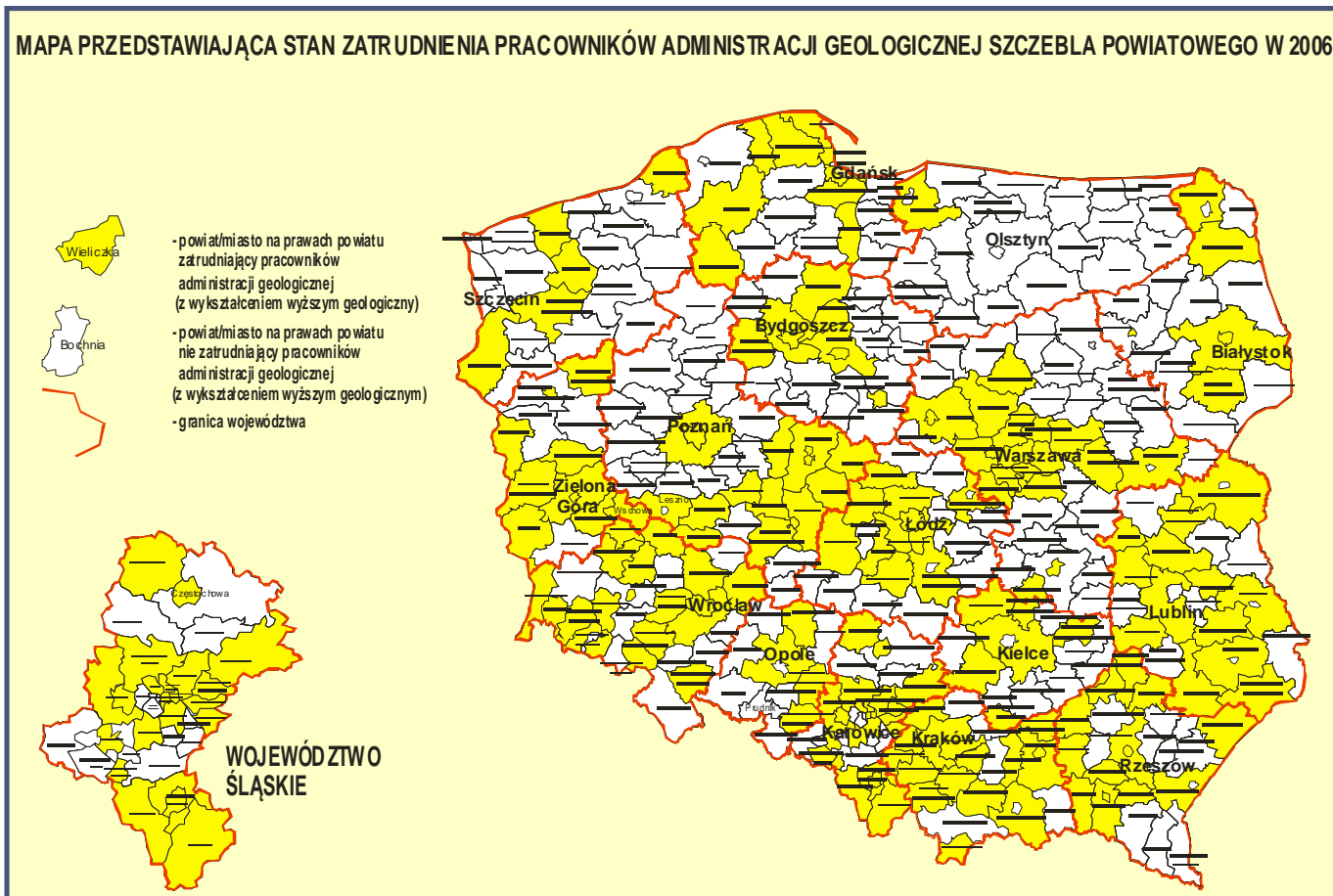
MAPA PRZEDSTAWIAJĄCA STAN ZATRUDNIENIA PRACOWNIKÓW ADMINISTRACJI GEOLOGICZNEJ SZCZEBLA POWIATOWEGO W 2006